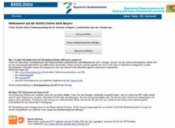
Screenshot des BAföG-Online-Portals

Die Website führt Sie Schritt für Schritt durch den gesamten Antrag und hilft Ihnen beim Ausfüllen: